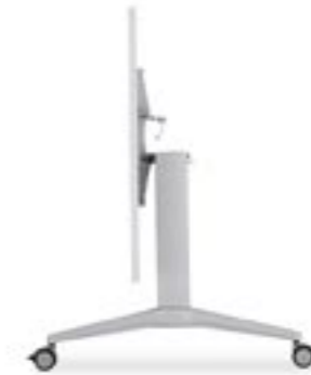
Klapptisch Folding table Plateau rabattable Tavolo ribaltabile