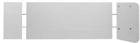
Seitliche Andock- und Anstell-Elemente Side docking or free-standing elements Éléments latéraux juxtaposables Elementi laterali d'aggancio e d'appoggio