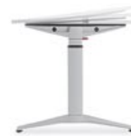
Plattenneigung Tilting worktop Inclinaison du plateau Inclinazione del piano