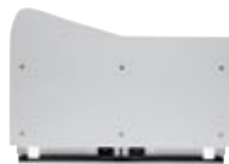
Schiebeplatte Sliding worktop Plateau coulissant Piano scorrevole