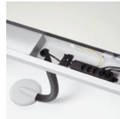
Schiebeplatte und Elektrifizierung Sliding top and cable tray Plateau coulissant et électrification Piano scorrevole ed elettrificazione