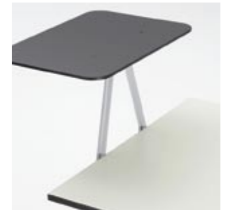
Tablar seitlich Stehtisch Standing desk with side shelf Pupitre latéral pour travail debout Supporto laterale del tavolo verticale