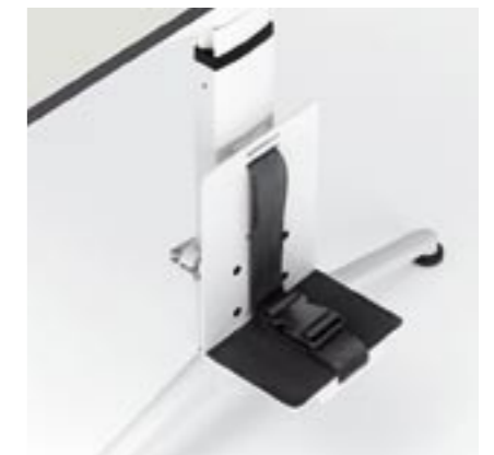
CPU-Halter CPU holder Support CPU Supporto CPU