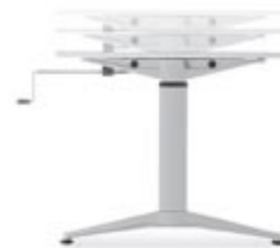
Höheneinstellung Height adjustment Réglage en hauteur Regolazione dell'altezza