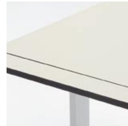
Anbauelement hinten Attachment element, rear view Élément rapporté à l'arrière Elemento componibile posteriore

Lista Reflect è stata studiata fin nei minimi dettagli, e si adatta a tutte le esigenze del lavoro d'ufficio quotidiano. Accanto all'esemplare funzionalità, un'ampia gamma di pratici accessori consente di arredare gli uffici in modo individualizzato e corrispondente alle esigenze dell'utente.