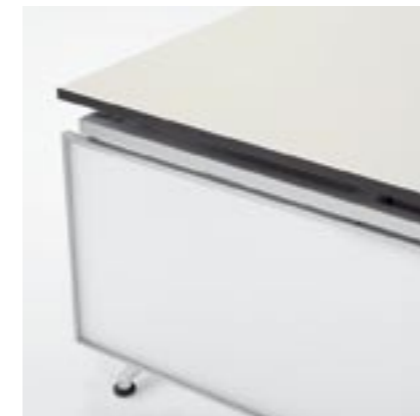
Rückwand Rear panel Paroi arrière Parete posteriore