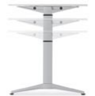
Sitz-/Stehtisch Sitting or standing desk Table position assise/debout Impiego ad altezza variabile