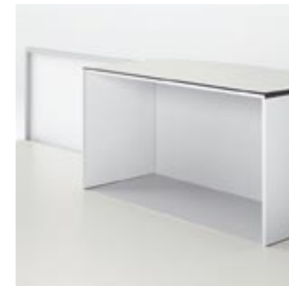
Thekenbox Counter-top box Casier de rangement Teca