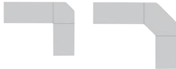
Verkettbarkeit zu Winkelkombinationen Linking with corner combinations Ensembles juxtaposés avec combinaisons d'angle Possibilità di concatenamento per combinazioni angolari