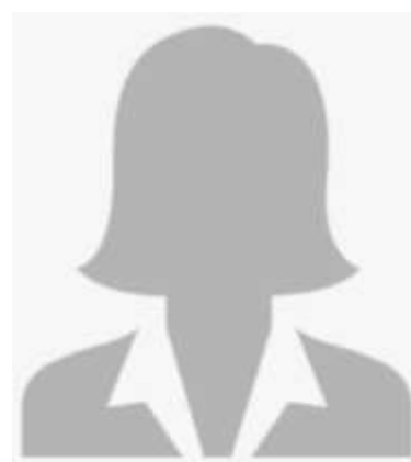
Sanja Willi Sachbearbeitung und Planung