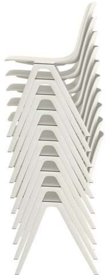
Stapelstuhl Brunner Hero