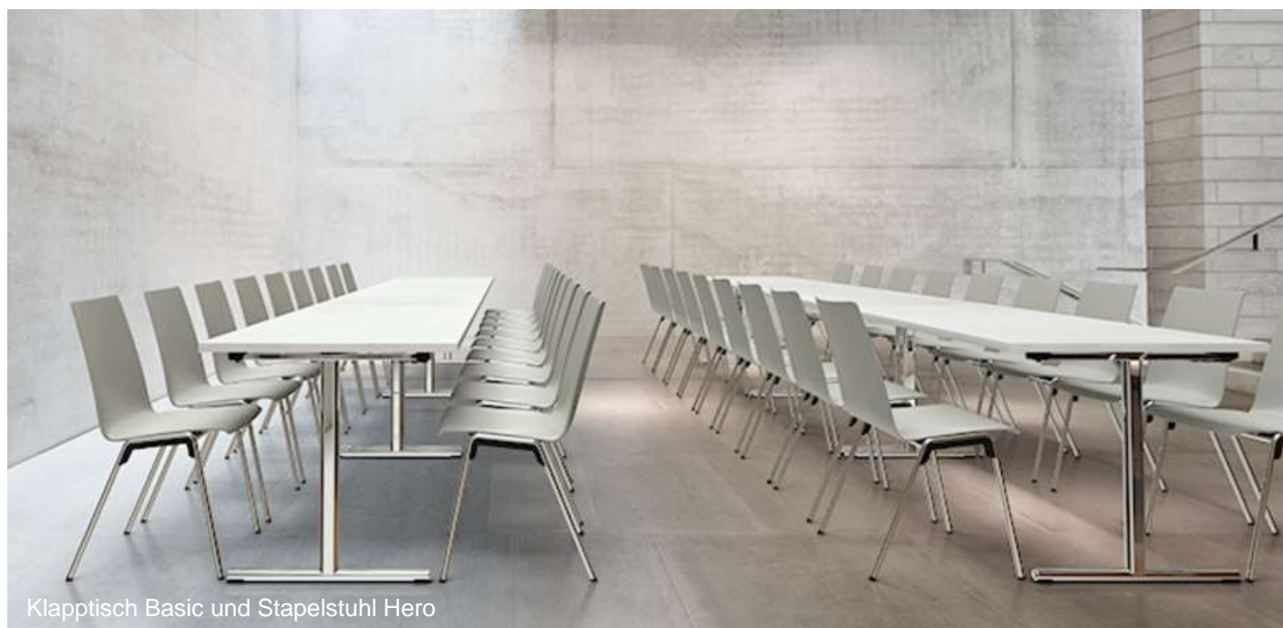
Klappstisch Basic und Stapelstuhl Hero