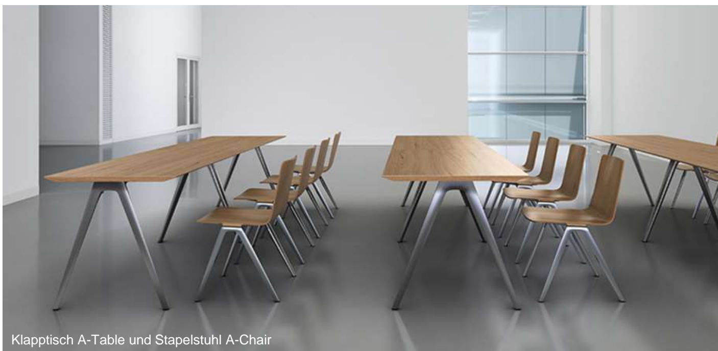
Klappstisch A-Table und Stapelstuhl A-Chair