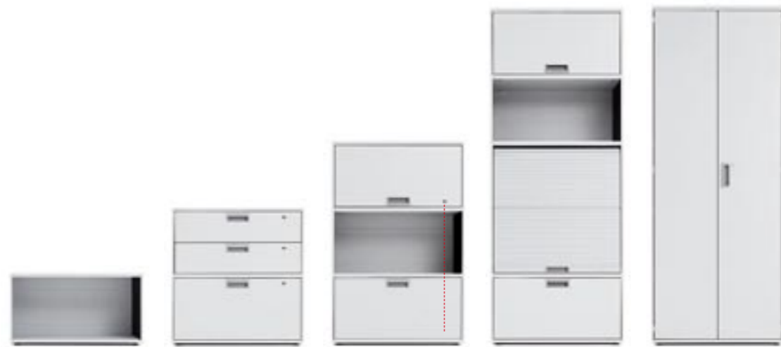
Einzelverschluss Individual locking Fermeture individuelle Chiusura singola