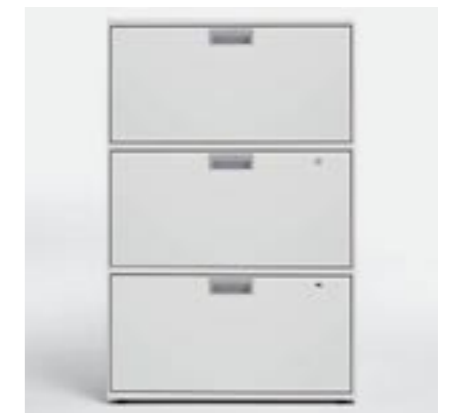
Fronten Fronts Faces avant Elementi frontali