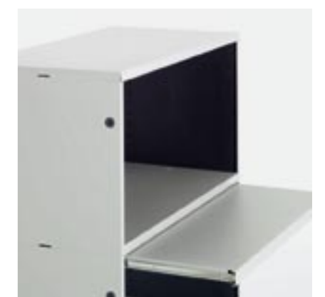
Ausziehtablar Pull-out shelf Rayon extensible Ripiano estraibile